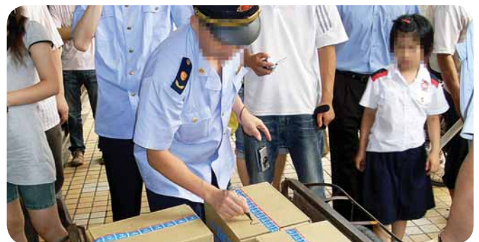
Полицейские облавы происходят, когда собрано достаточно доказательств.