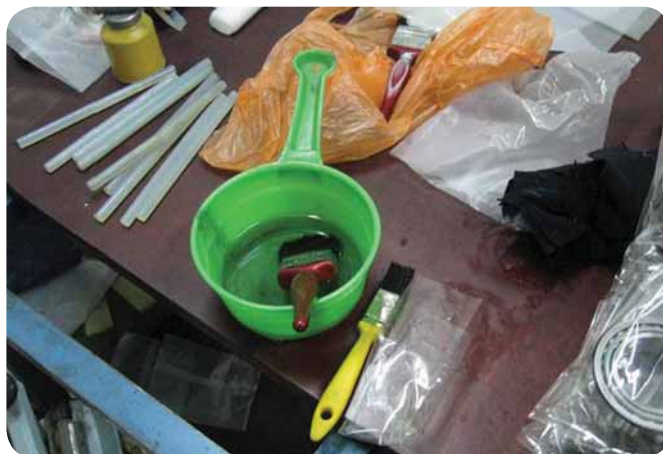
Обычные инструменты, используемые в контрафактных мастерских.

Вместо того чтобы получать продукцию высокого качества, Вы приобретаете продукцию низкого качества по завышенной цене.