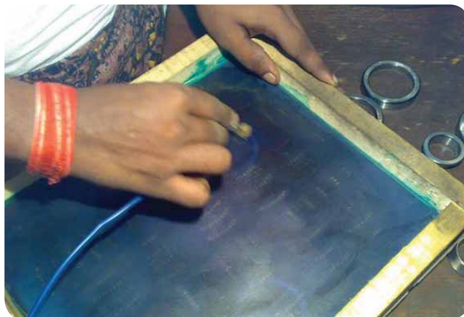
Фальшивая маркировка гравировается на подшипниках при помощи шелковых экранов наподобие этого.