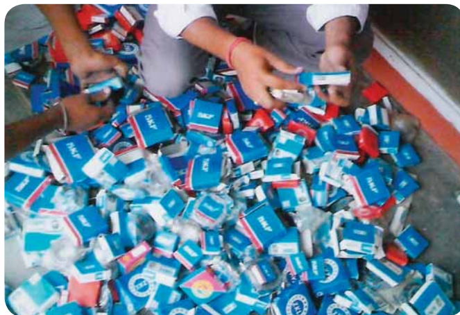
Фальшивые подшипники, конфискованные полицией во время облавы.