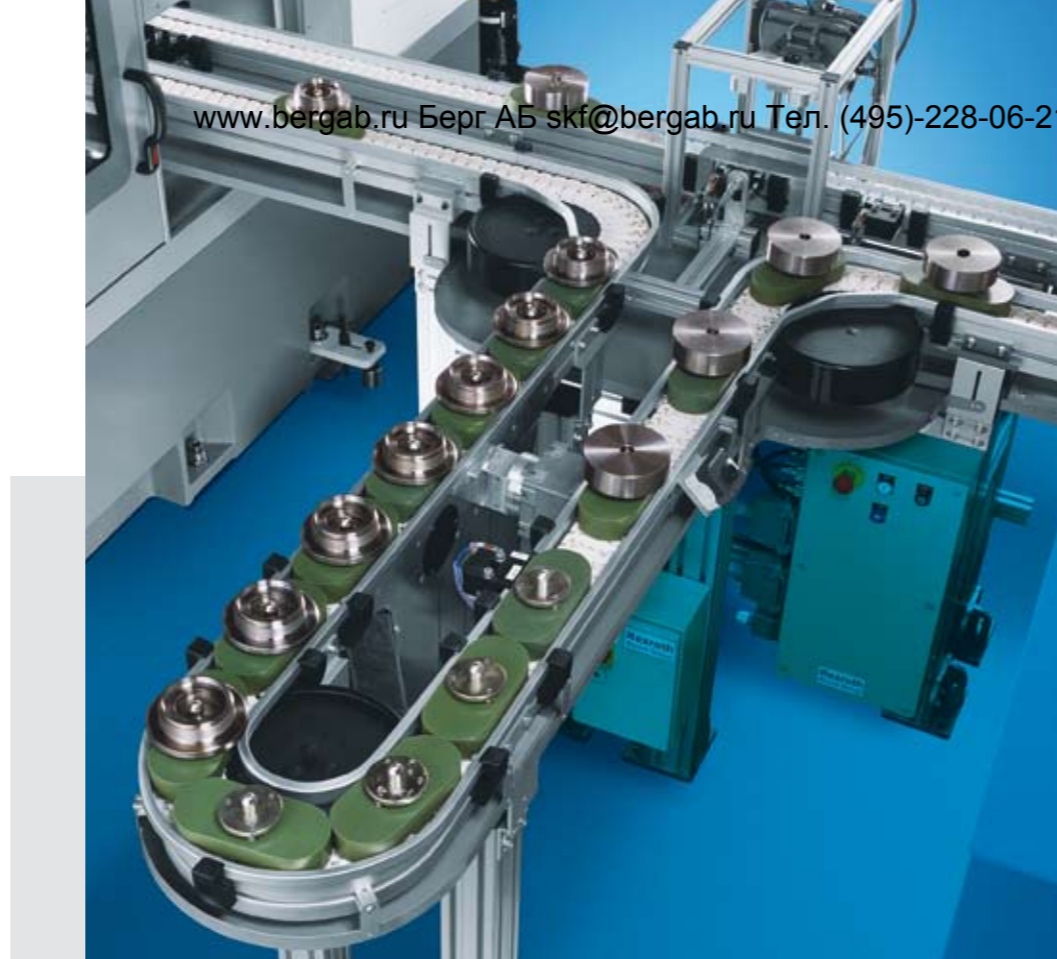
Применение в машиностроении

Разнообразие в применении Система Rexroth VarioFlow – это экономичная транспортная система, применяемая во многих областях. Семь различных вариантов ширины цепи, от 65 до 320 мм, могут применяться в различных отраслях: от машиностроения и электронной промышленности до фармацевтической и косметической.