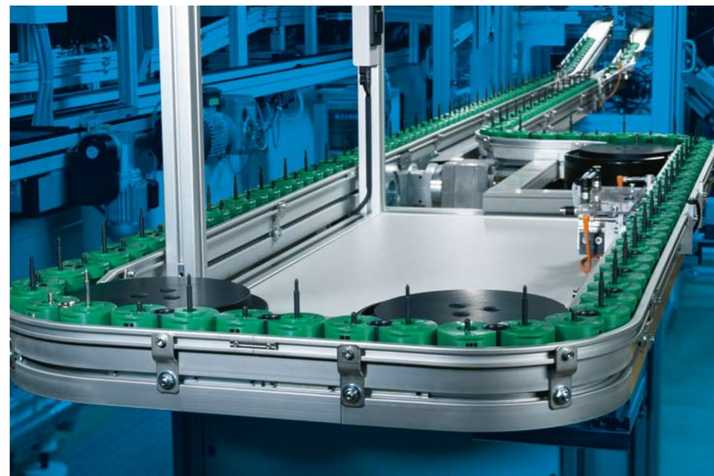
Транспортировка в производстве электродвигателей