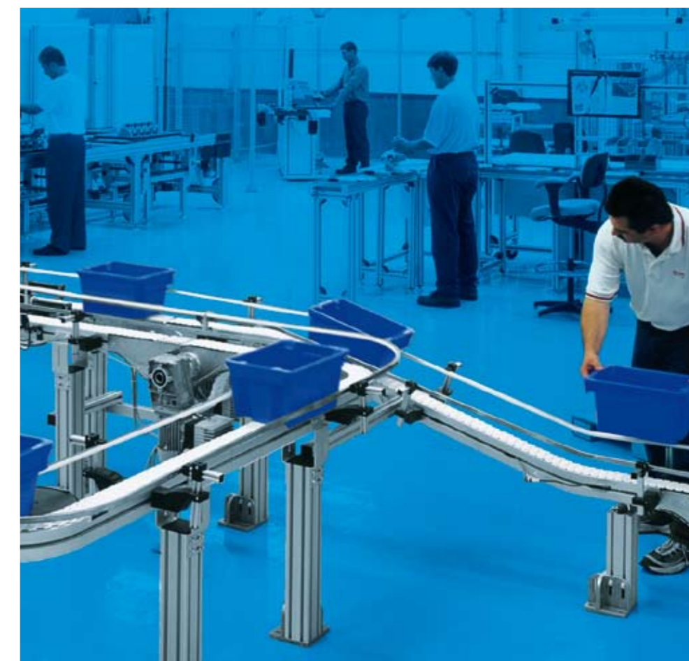
Транспортировка контейнеров в упаковочном производстве

Для изделий любой формы Благодаря новой модульной системе можно транспортировать изделия неправильной формы. Несущие элементы системы могут иметь различные исполнения и могут быть приспособлены для изделий различных размеров и под различные применения. Данная система расширяет спектр применения VarioFlow и позволяет при этом сэкономить время и средства.