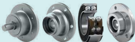
Узлы Agri Hub