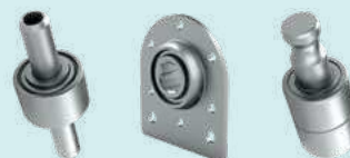
Приводной вал высевающего аппарата