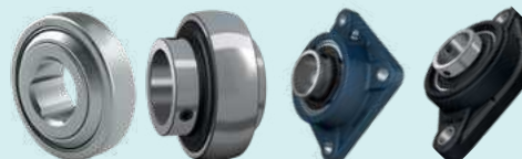
Устройство очистки / разгрузочный шнек