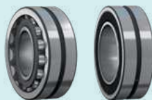
Наклонная камера / ротор молотилки