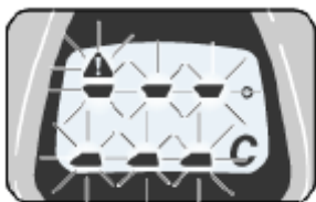
Выход за диапазон